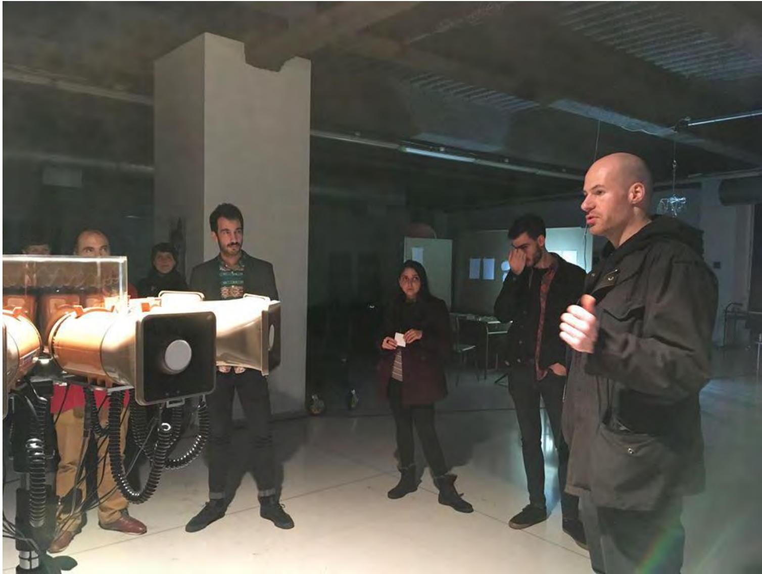
Jornadas Performance. MEM Exhibition Hall