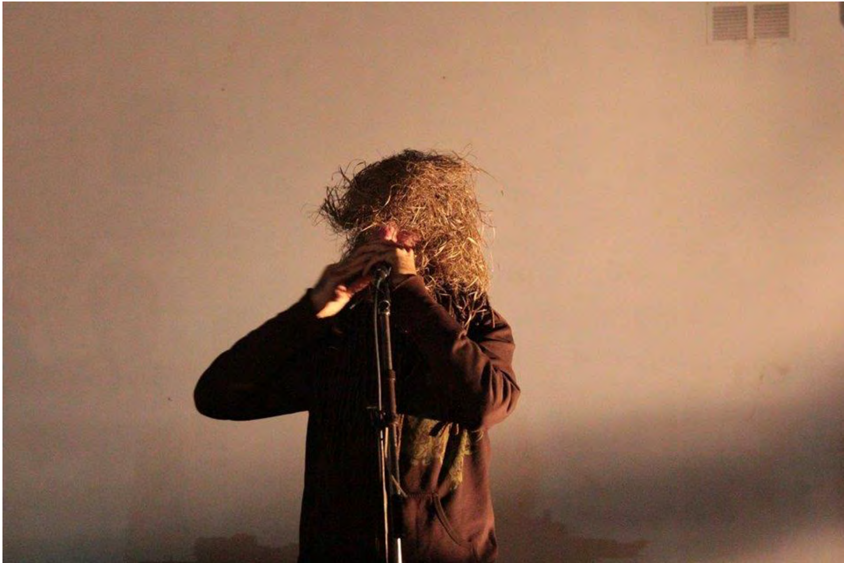
Jornadas Performance. MEM Exhibition Hall