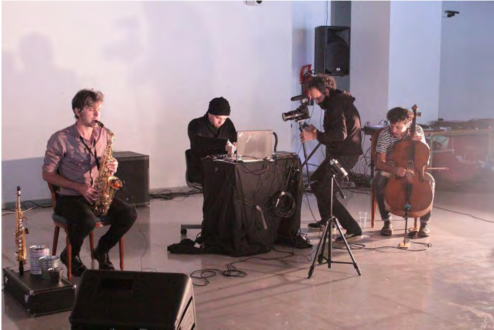
Jornadas Performance. MEM Exhibition Hall