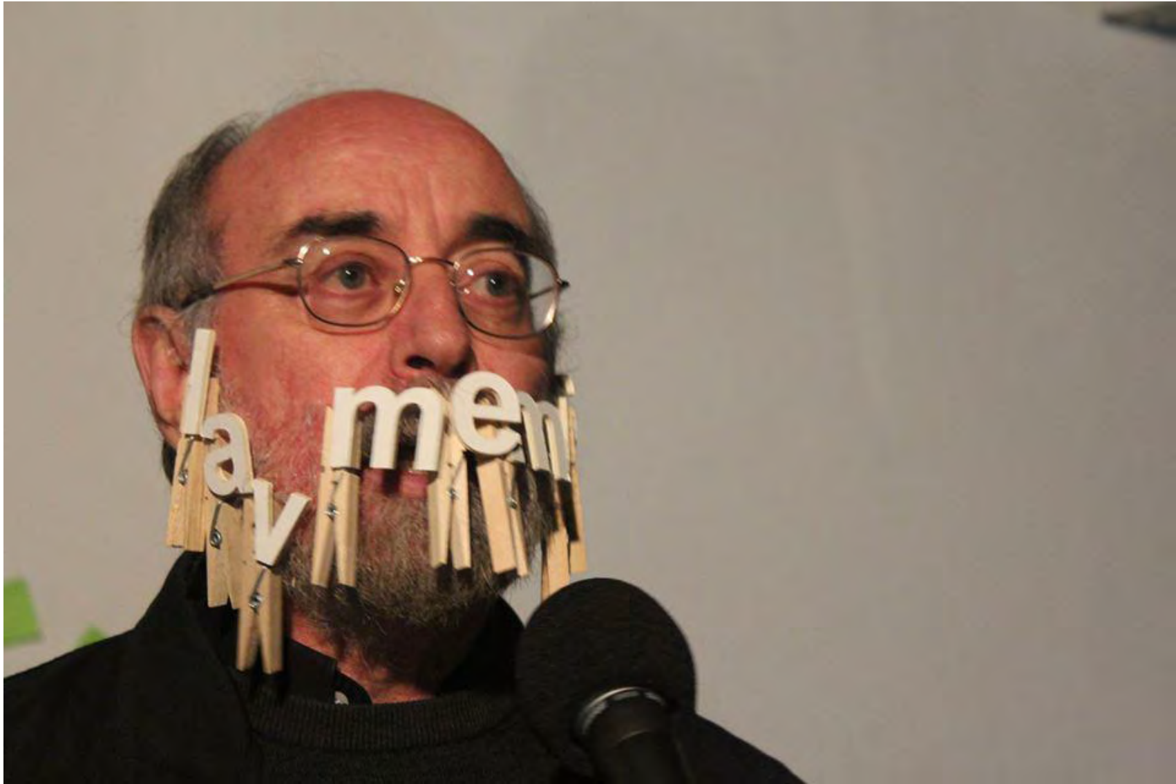
Jornadas Performance. MEM Exhibition Hall