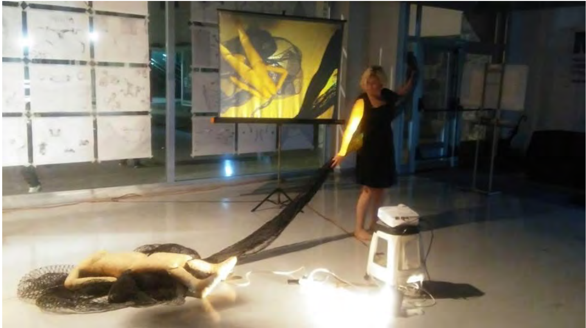
Jornadas Performance. MEM Exhibition Hall