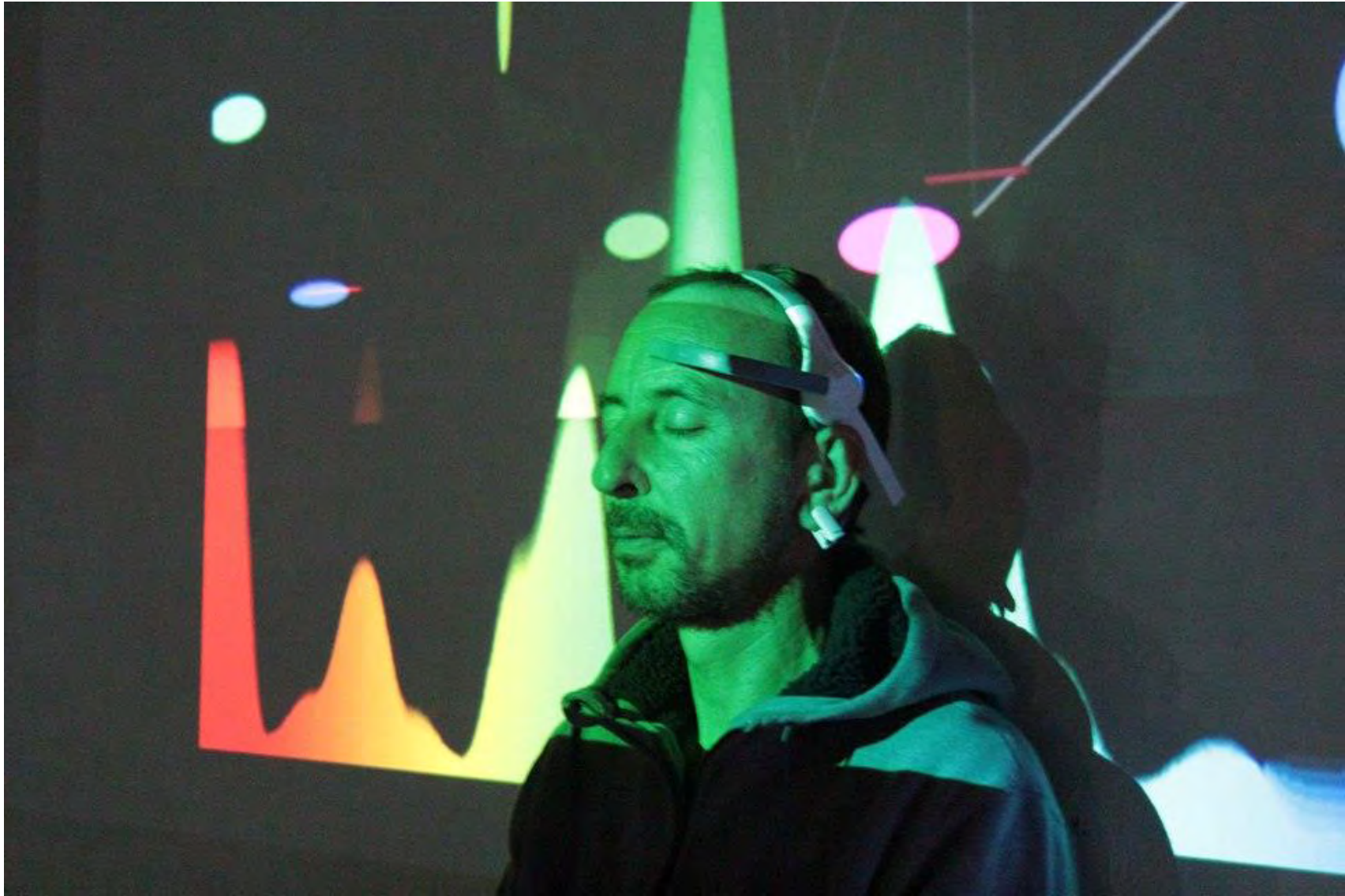
Jornadas Performance. MEM Exhibition Hall