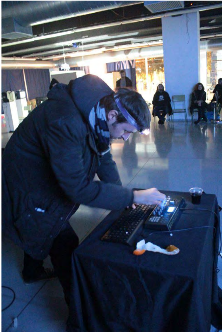
Jornadas Performance. MEM Exhibition Hall