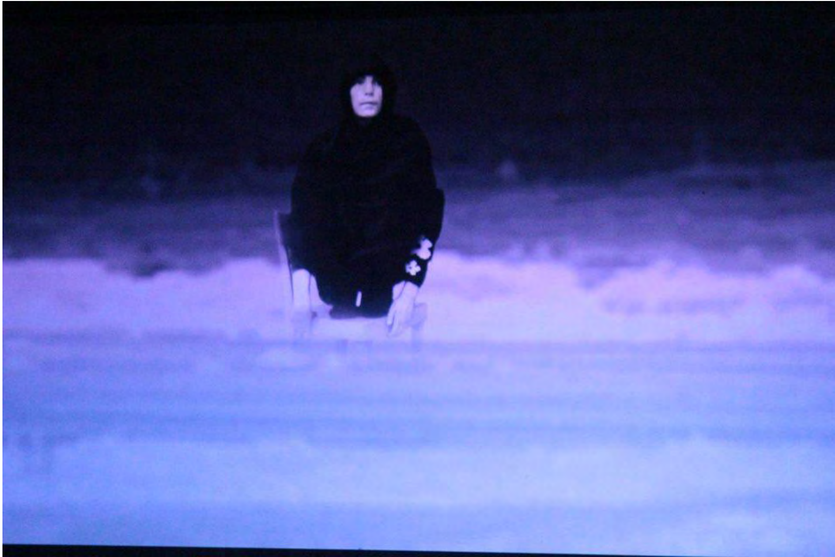
Jornadas Performance. MEM Exhibition Hall