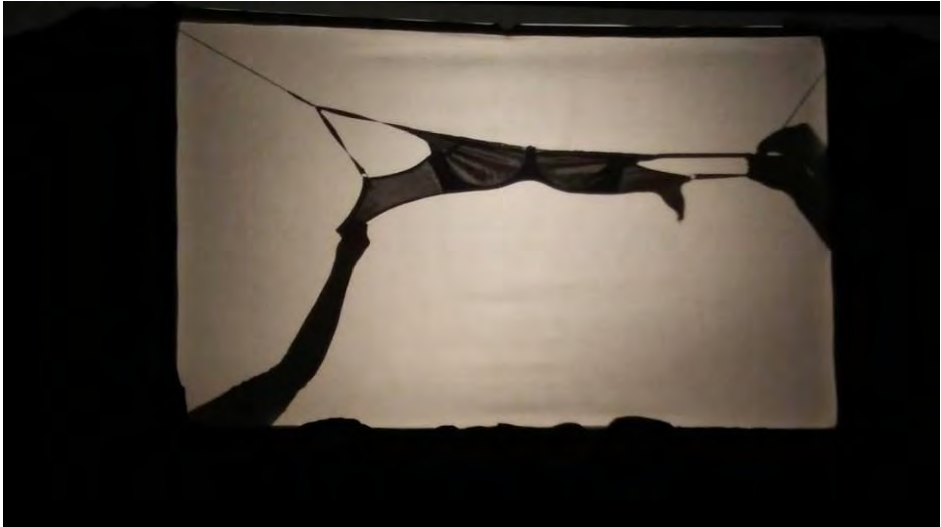
Jornadas Performance. MEM Exhibition Hall