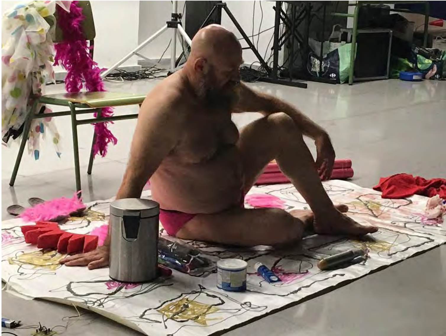
Jornadas Performance. MEM Exhibition Hall