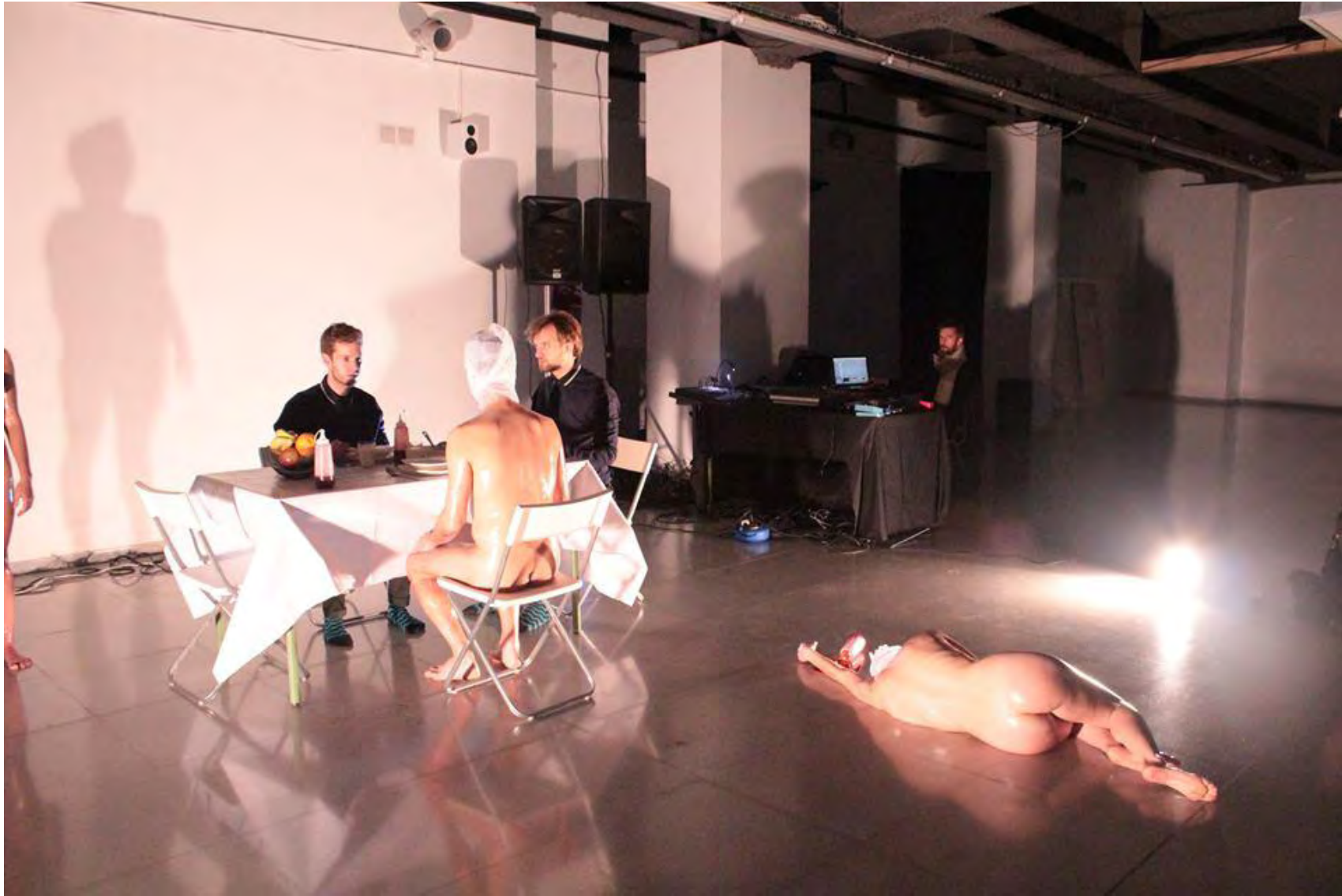
Jornadas Performance. MEM Exhibition Hall