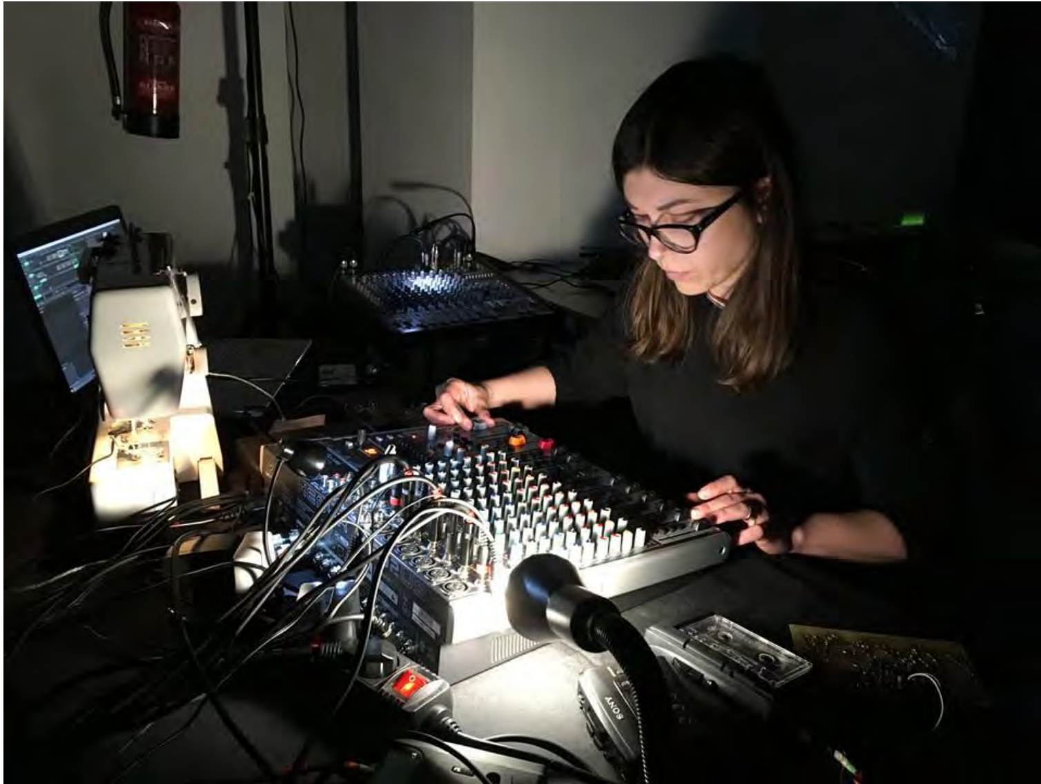
Jornadas Performance. MEM Exhibition Hall