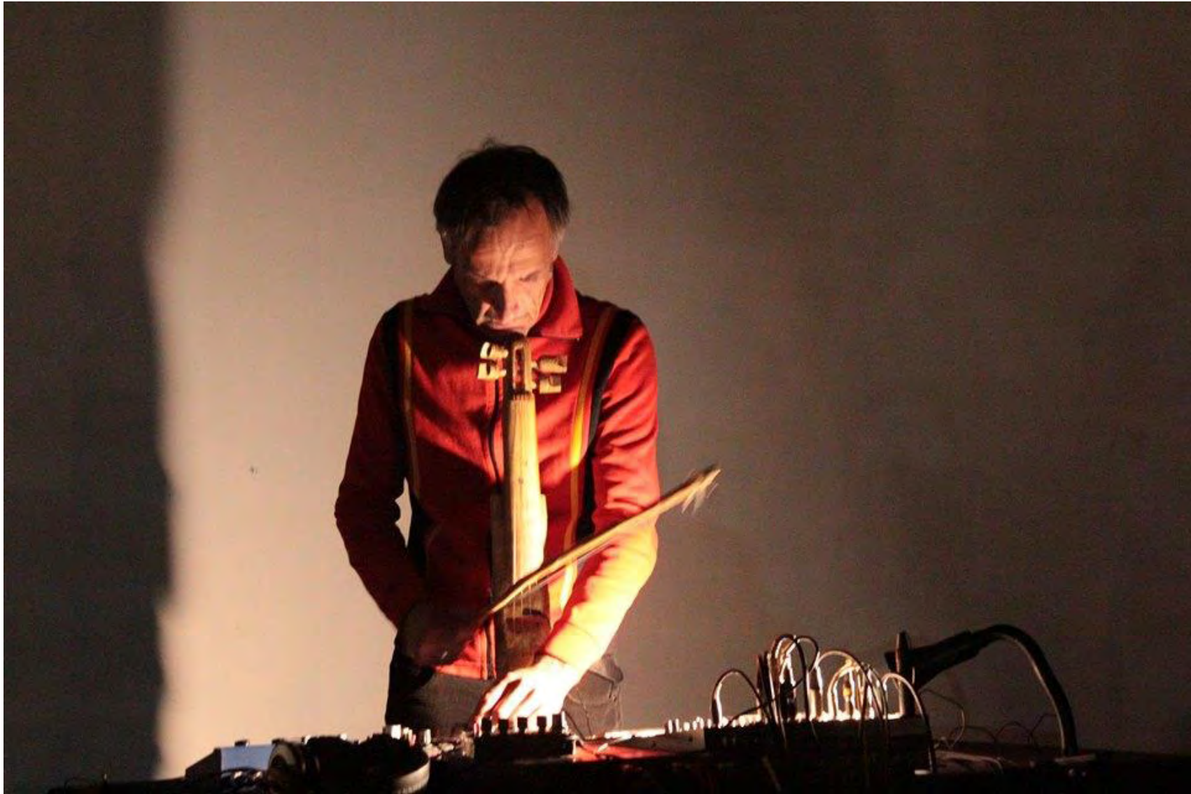
Jornadas Performance. MEM Exhibition Hall