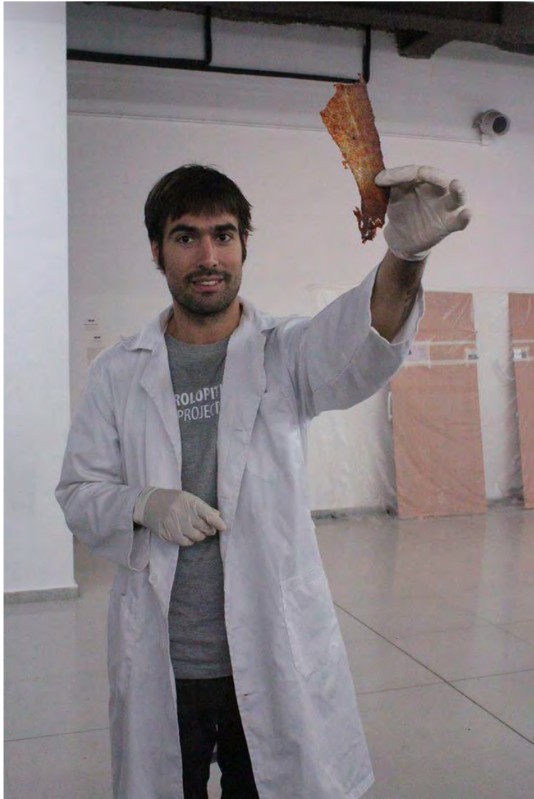
Jornadas Performance. MEM Exhibition Hall