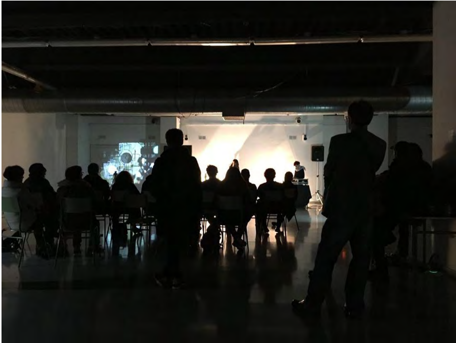
Jornadas Performance. MEM Exhibition Hall